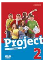
Project 3rd ed.