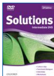
Maturita Solutions 2nd ed.

Elementary Pre-Intermediate Intermediate