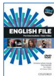
English File 3rd ed.

Elementary Pre-Intermediate Intermediate