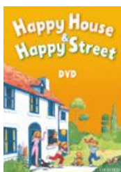
New Happy Series

Pokud jste zakoupili min. 90 ks , zaškrtněte 3 tituly .